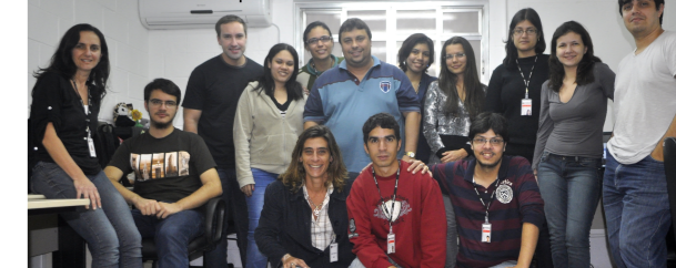
Parte da equipe do DINF dedicada ao SIGES