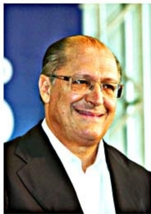
Governador tem 55% das intenções de voto, segundo o Datafolha

Se a disputa presidencial se transformou em uma grande incógnita, em São Paulo o governador Geraldo Alckmin seria reeleito no primeiro turno, revela o instituto Datafolha. Ele tem 55% das intenções de voto, mais que o dobro da soma de seus adversários. Em segundo lugar aparece Paulo Skaf, do PMDB, com 16%, e em terceiro Alexandre Padilha, do PT, com 5%.