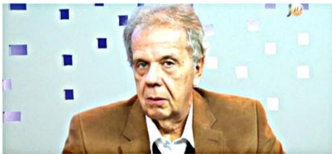
Confira a entrevista completa:

teve uma atitude firme, leal e discreta a Eduardo Campos nos últimos dez meses. "O único ponto contra ela é sua não vinculação ao PSB, mas a conjuntura mudou e é provável que ela assuma um compromisso de manter-se na legenda".