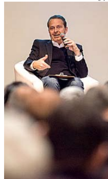
>PESAR - Nota relembra trajetória de Campos

A Coligação “Unidos pelo Brasil”, formada pelo PSB, Rede Sustentabilidade, PPS, PPL, PHS, PRP e PPL, também emitiu pronunciamento, onde destaca a frase dita pelo ex-governador na véspera do acidente “Não vamos desistir do Brasil”.