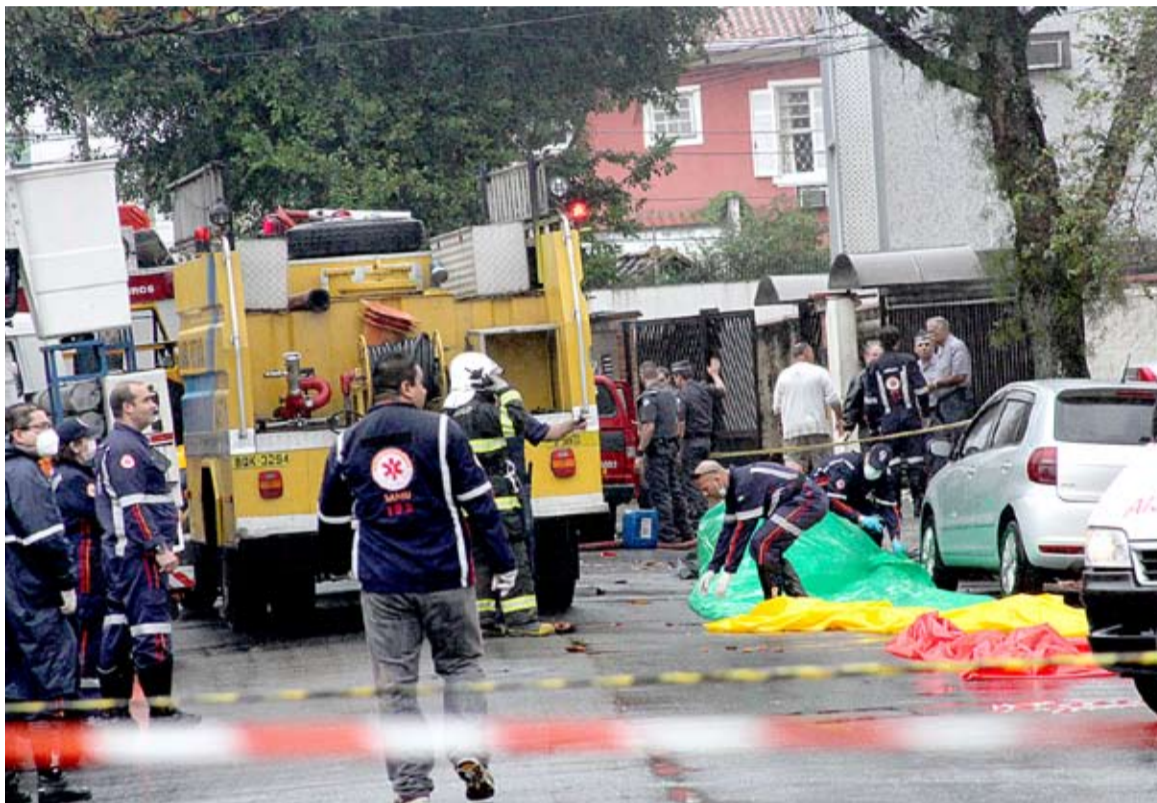
►BLOQUEIO - Polícia manteve as ruas bloqueadas para facilitar trabalho de socorristas e bombeiros