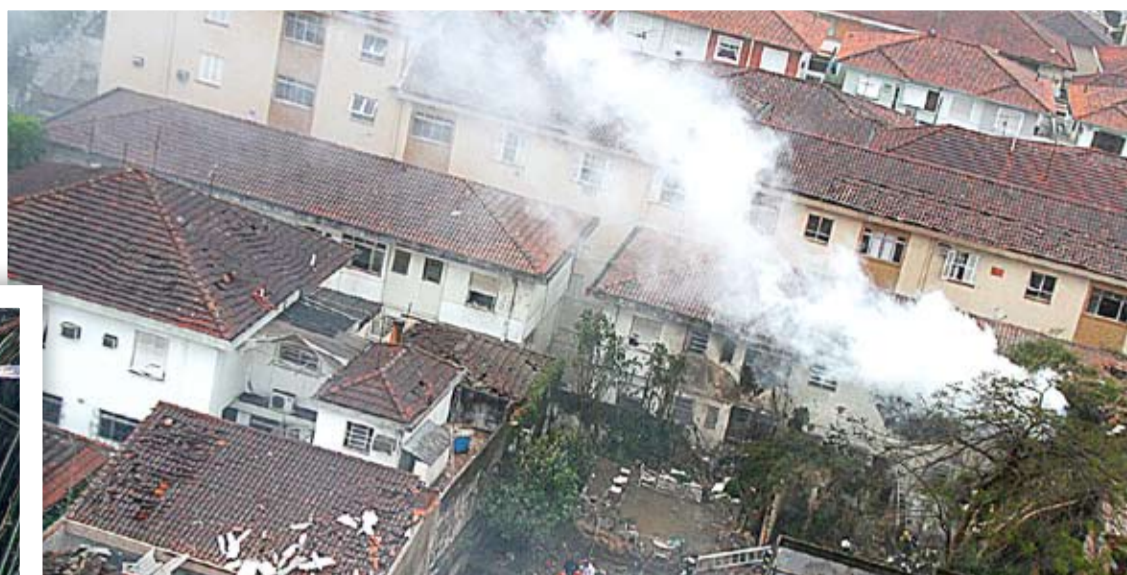
>LOCAL - Avião que conduzia Eduardo Campos e assessores caiu sobre casas no Boqueirão