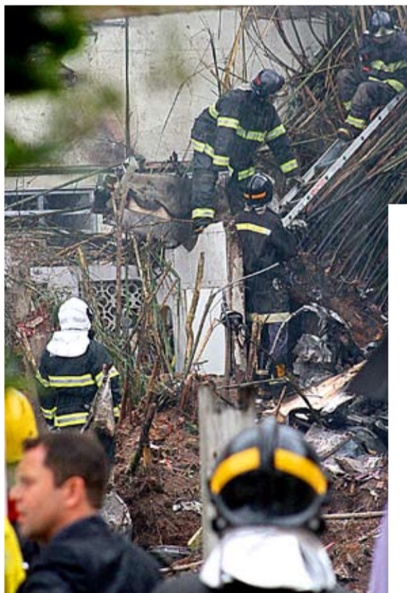
>DESTROÇOS - Populares afirmam que aeronave estava em chamas antes de cair