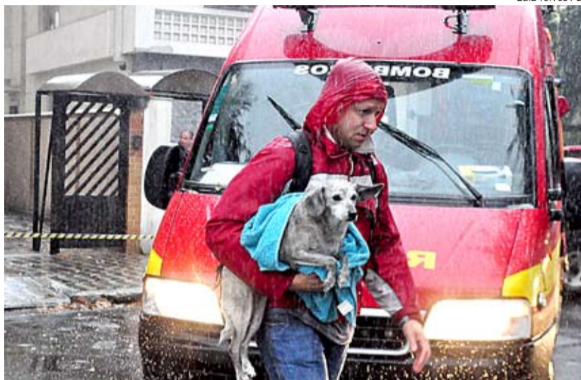
>QUEDA DE AVIÃO - Morador deixa prédio onde mora com cão após queda de avião que matou Eduardo Campos e mais seis pessoas, no bairro do Boqueirão, em Santos, ontem