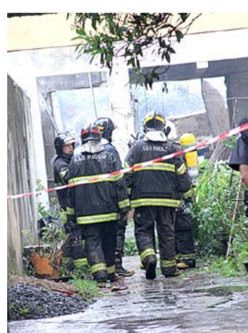
>FAMÍLIAS foram obrigadas a deixarem suas casas