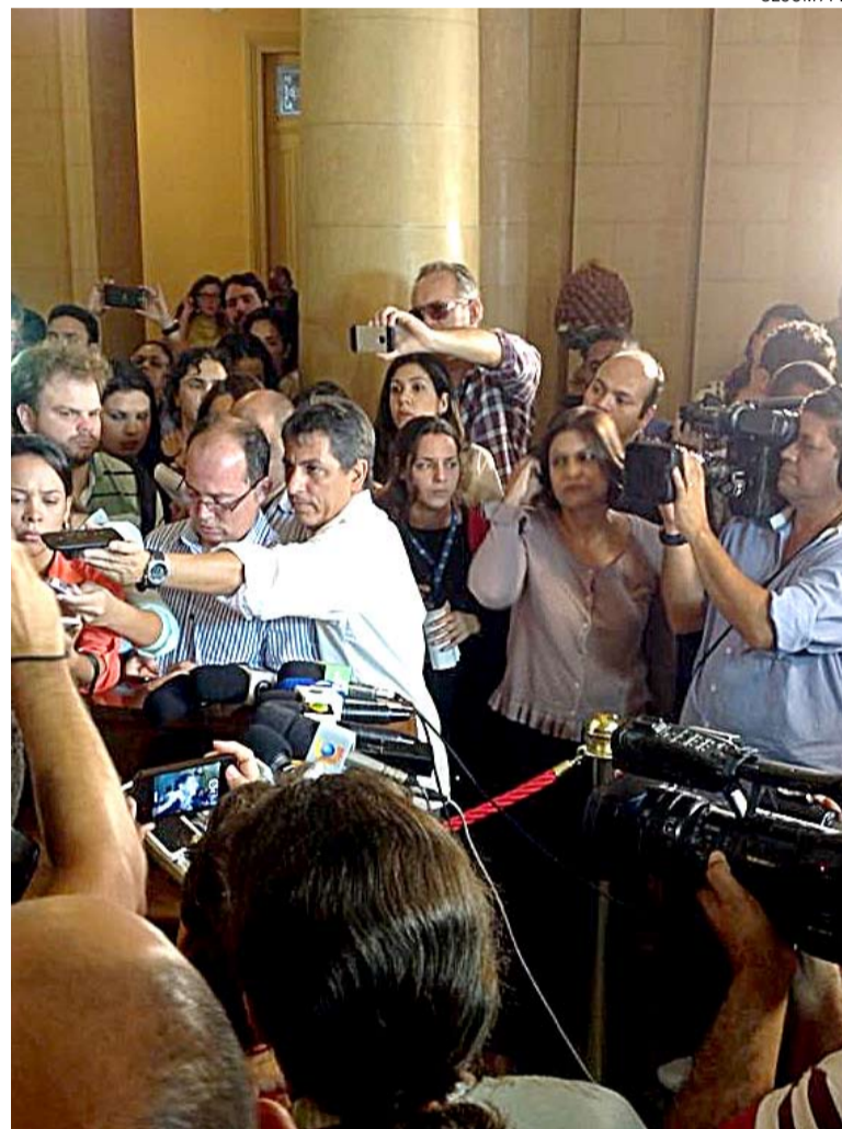
COLETIVA > - O governador de Pernambuco, João Lyra Neto, decretou sete dias de luto pela morte de Campos

Em vários municípios do interior, já há informações sobre a formação de caravanas em direção à capital.