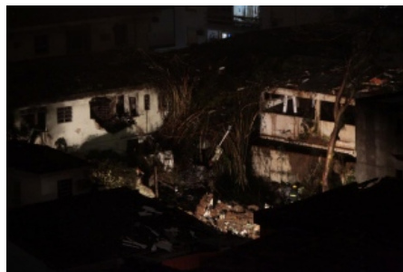
Buscas seguiram durante toda a madrugada

Os bombeiros concentravam as buscas desde a tarde de quarta-feira em uma área onde suspeitavam estar a cabine, embaixo de uma laje de uma das casas atingidas. Eles passaram a trabalhar no local com retroescavadeiras e manualmente. Segundo o capitão Marcos Palumbo, a carteira do político e outros documentos estavam juntos aos restos mortais que foram localizados durante uma escavação no terreno. "Às 5h10, a equipe conseguiu localizar parte de um corpo e uma carteira. Verificamos que era do candidato Eduardo Campos", anunciou Palumbo.